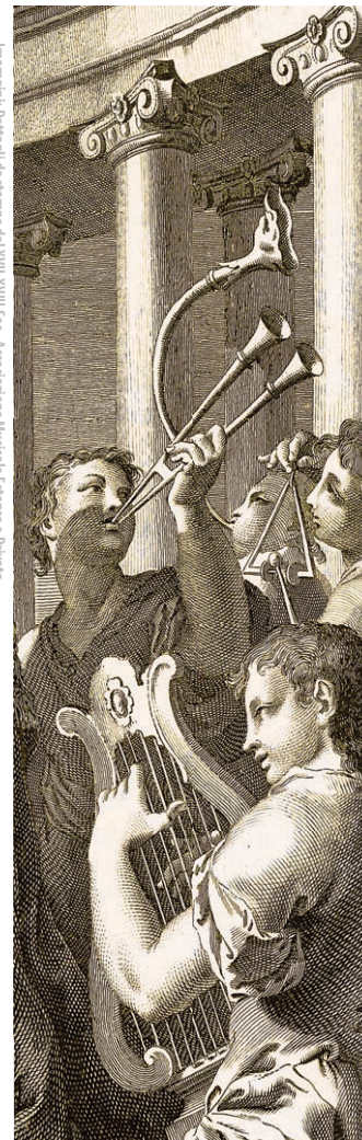
Immagine: Dettaglio da stampe del XVIII-XVIII Sec., Associazione Musicale Estense e Privato

Si ringrazia BPER Banca per il contributo tramite Art bonus